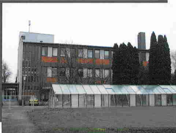
Burgonyakutatói Központ, Főépület