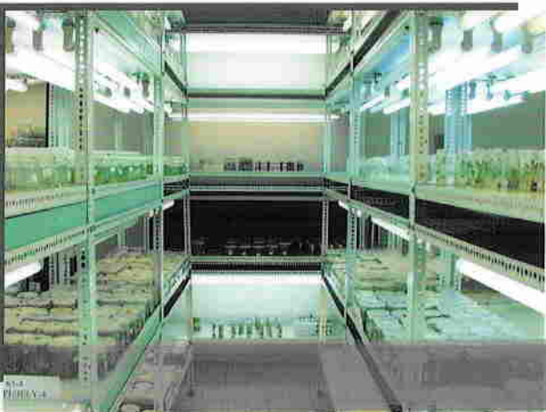
Burgonyakutatói Központ, Génbank