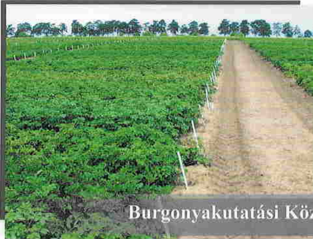
Burgonyakutatói Központ Nemesítési Program, Tenyészkert