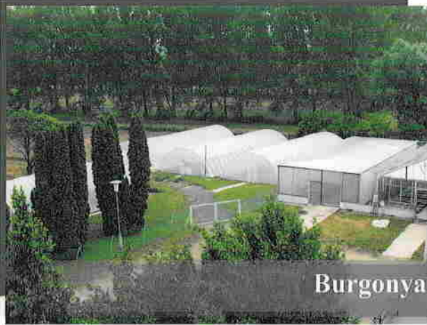
Burgonyakutatói Központ, Fajtafenntartó Telep