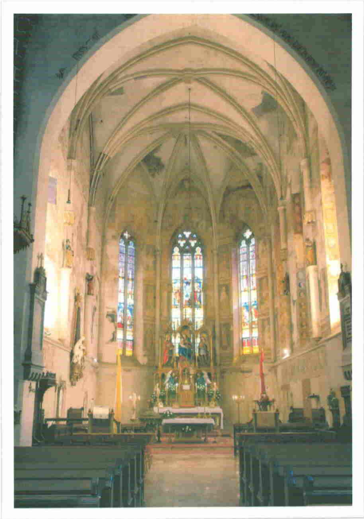
4. A templom szentélye