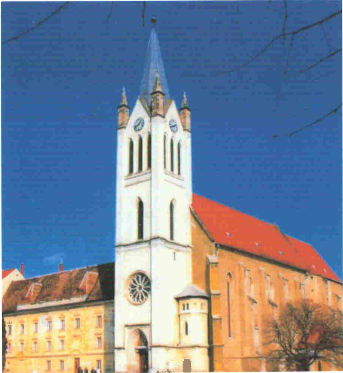
1. A Fő téri templom és kolostor (rendház)