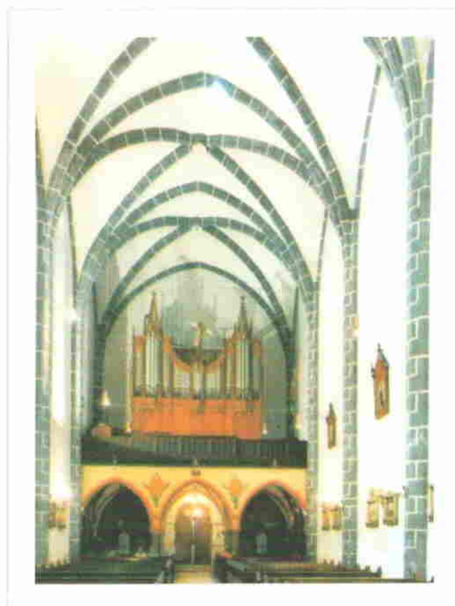
3. Az 1400 körüli templomhajó (háttérben az 1900 körüli orgonakarzat)