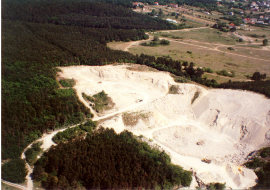
3/b számú fénykép